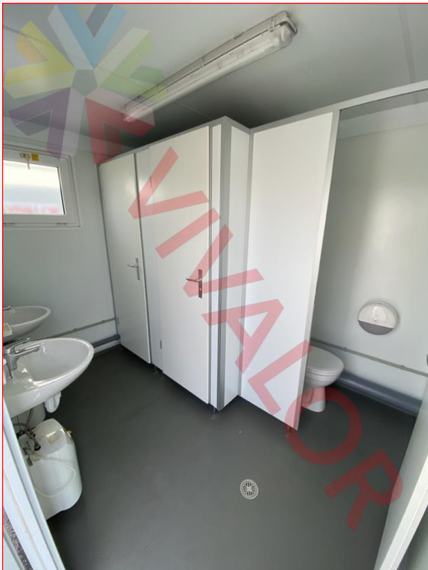
3. Côté femmes