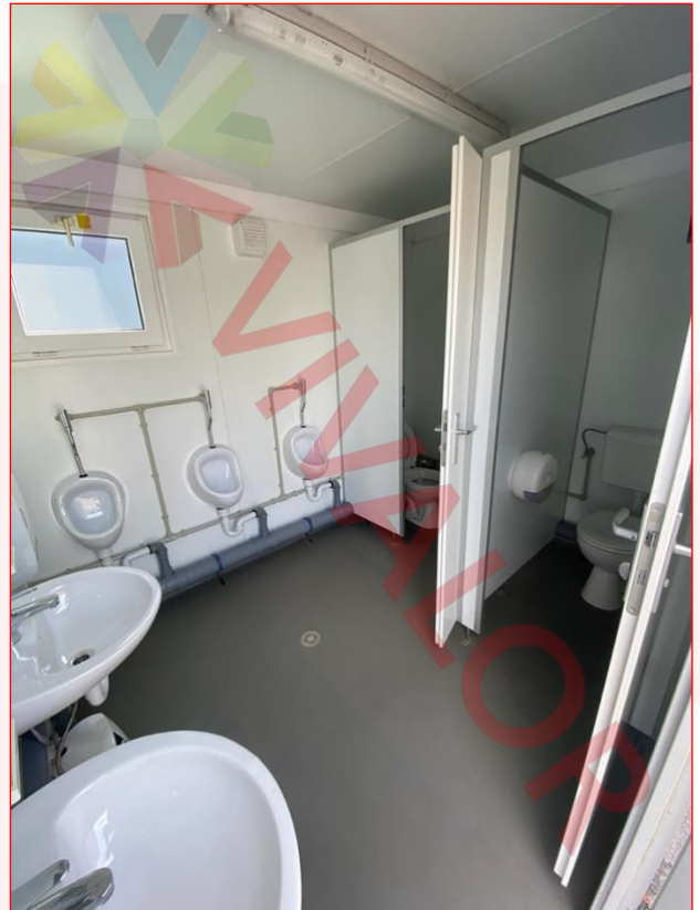
4. Côté hommes